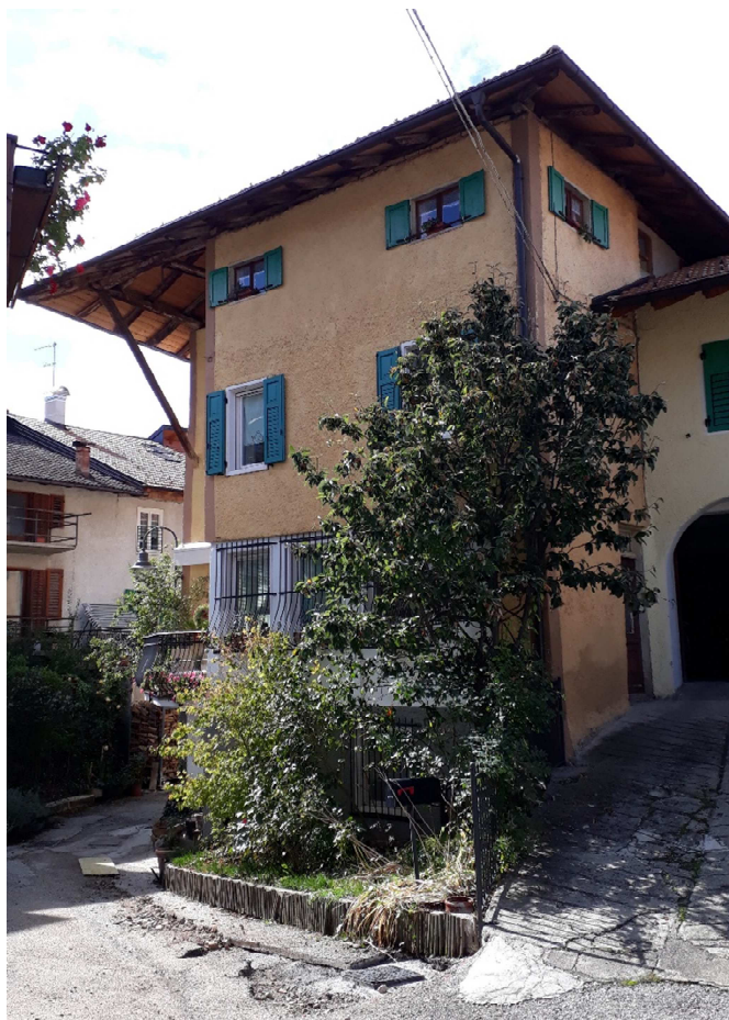
Vista da est