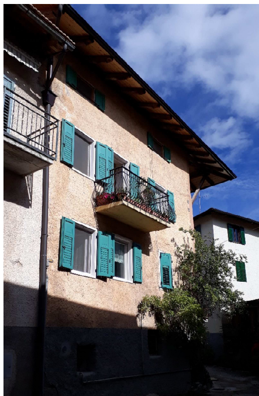
Vista da ovest